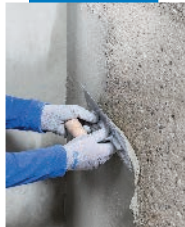
Aplicación con llana de Planitop Enrasa & Repara R4

Realice el acabado o afine con una flota o esponja, cuando el mortero empiece a endurecer. Los tiempos de espera para realizar esta operación varían en función de las condiciones meteorológicas. Como acabado final de color y de protección del soporte, aplique un recubrimiento elastomérico de la línea Elastocolor o un producto acrílico de la