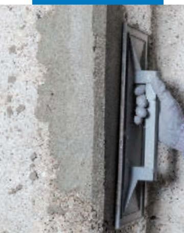
Alisado de Planitop Enrasa & Repara R4 con flota

Planitop Enrasa & Repara R4: mortero cementicio tixotrópico y estructural, fibrorreforzado, de fraguado rápido y retracción compensada, para reparación estructural y detallado del concreto, de conformidad con la EN 1504-3 clase R4 y la EN 1504-2 como revestimiento (C) principios MC e IR.