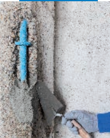
Aplicación con cuchara de Planitop Enrasa & Repara R4