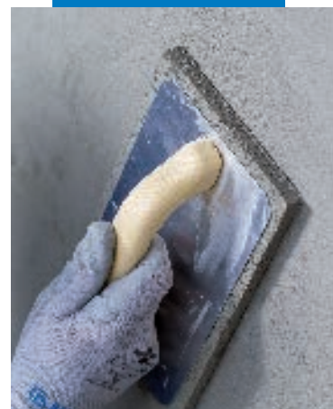
Afine de Planitop Enrasa & Repara R4